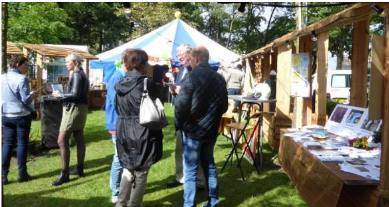
Kraam van Klarenbeeks Belang

Om de belangen van het dorp en het buitengebied goed te kunnen behartigen is het contact met de Klarenbeekse bevolking erg belangrijk.