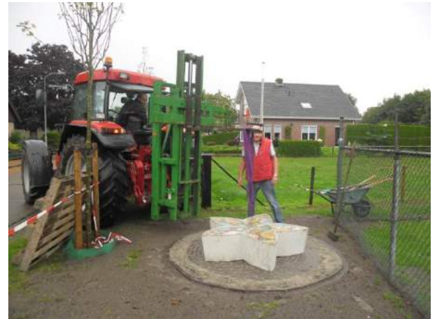
De plaatsing op 9 september