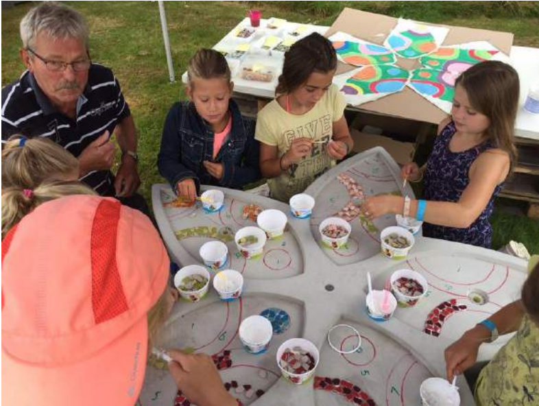
Tijdens de vakantiespeelweek hebben kinderen het mozaïek gelegd.